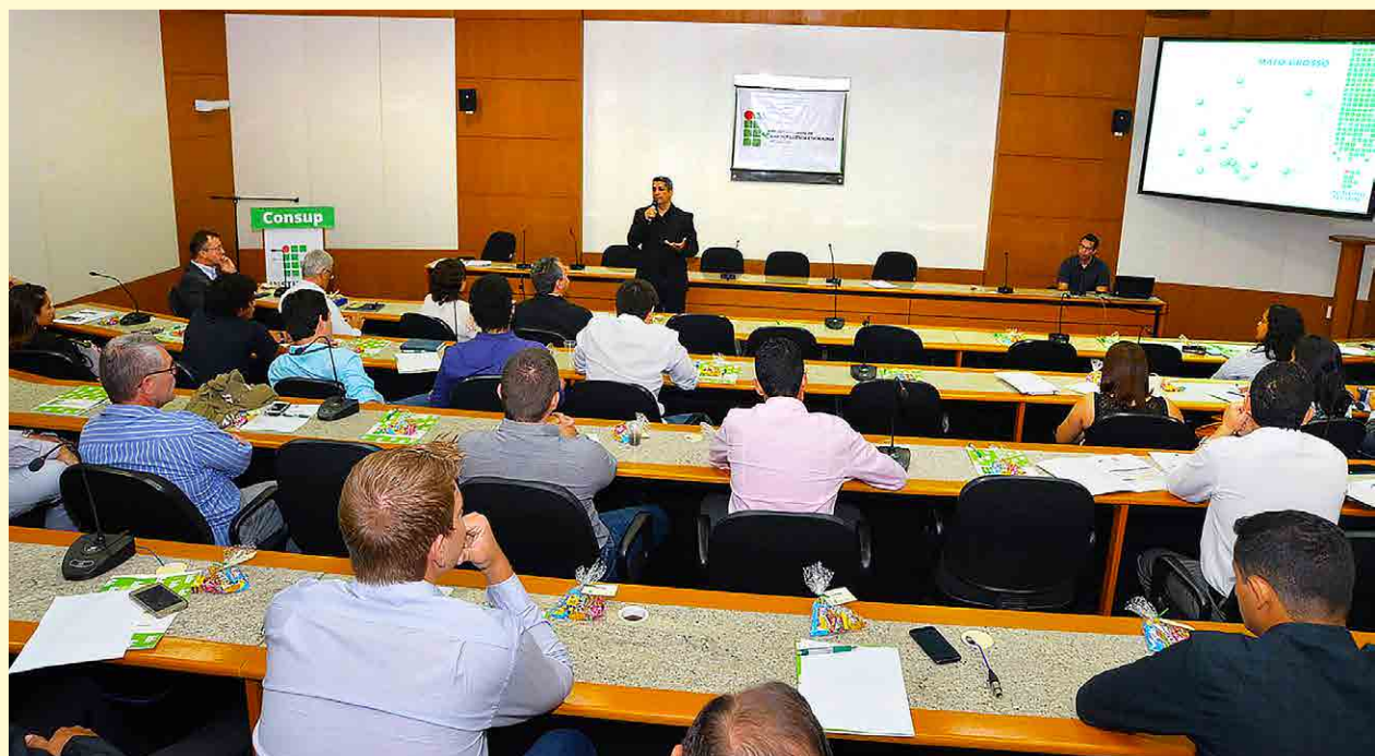
Posse dos novos conselheiros do Consup - Gestão 2016-2018

Relatório de Gestão Anual, emitindo parecer conclusivo sobre a propriedade e regularidade dos registros; deliberar sobre taxas, emolumentos e contribuições por prestação de serviços em geral a serem cobrados pelo IFMT; autorizar a criação, alteração curricular e extinção de cursos no âmbito do IFMT, bem como o registro de diplomas; aprovar a estrutura administrativa e o Regimento Geral da Instituição, observados os parâmetros definidos pelo Governo Federal e legislação específica; e deliberar sobre questões submetidas a sua apreciação.