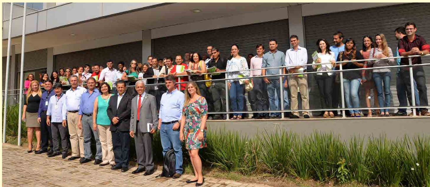
Reitor do IFMT empossou em janeiro de 2016, 60 novos servidores