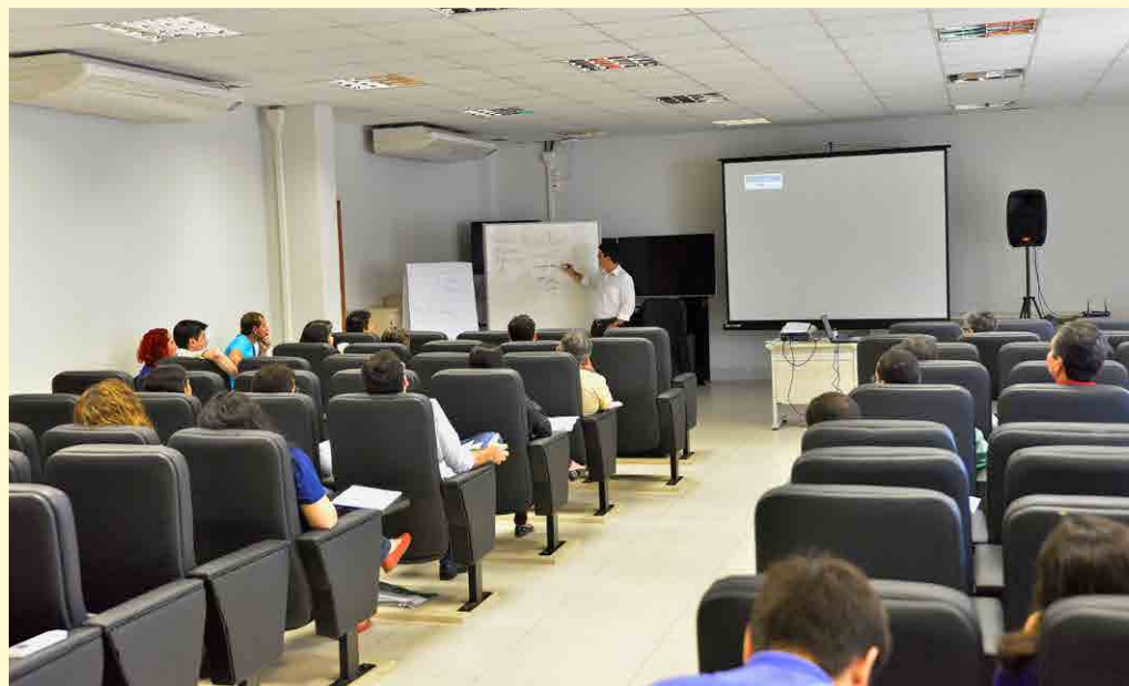
Curso de Análise de Planilha de Obras realizado em setembro de 2016

A Proad realiza contratações que sustentam a estrutura física e de serviço para atendimento da sociedade interna e externa, bem como, avalia, adquire e liquida dentro do planejamento orçamentário e financeiro bens e serviços para garantir o desenvolvimento da atividade-fim da instituição, qual seja, em educação e em todas as suas modalidades.