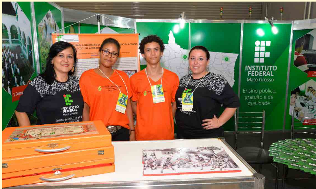
Estudantes e professores do IFMT apresentam pesquisa na Semana Nacional de Ciência e Tecnologia

Horário de funcionamento/atendimento: de segunda à sexta-feira das 8h às 18h